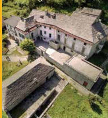
Corna Imagna. Bibliostera Cà Berizzi