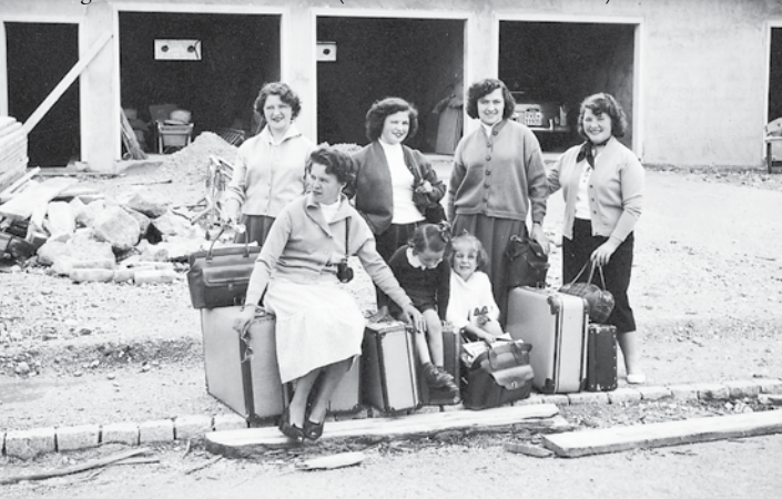
Emigranti della Valle Brembilla (anni Sessanta del Novecento)