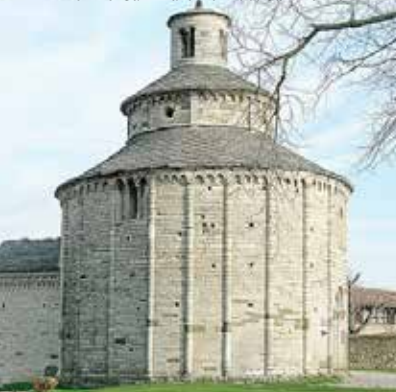
Almenno San Bartolomeo, San Tomè